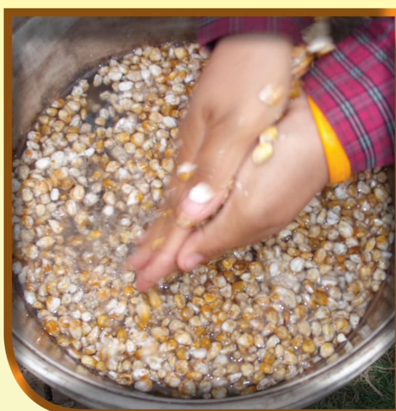
ผสมน้ำฉีดพ่นเชื้อราขาวบิวเวอเรีย โดยพ่นให้ถูกตัวแมลงศัตรูพืช หรือบริเวณที่แมลงอาศัย