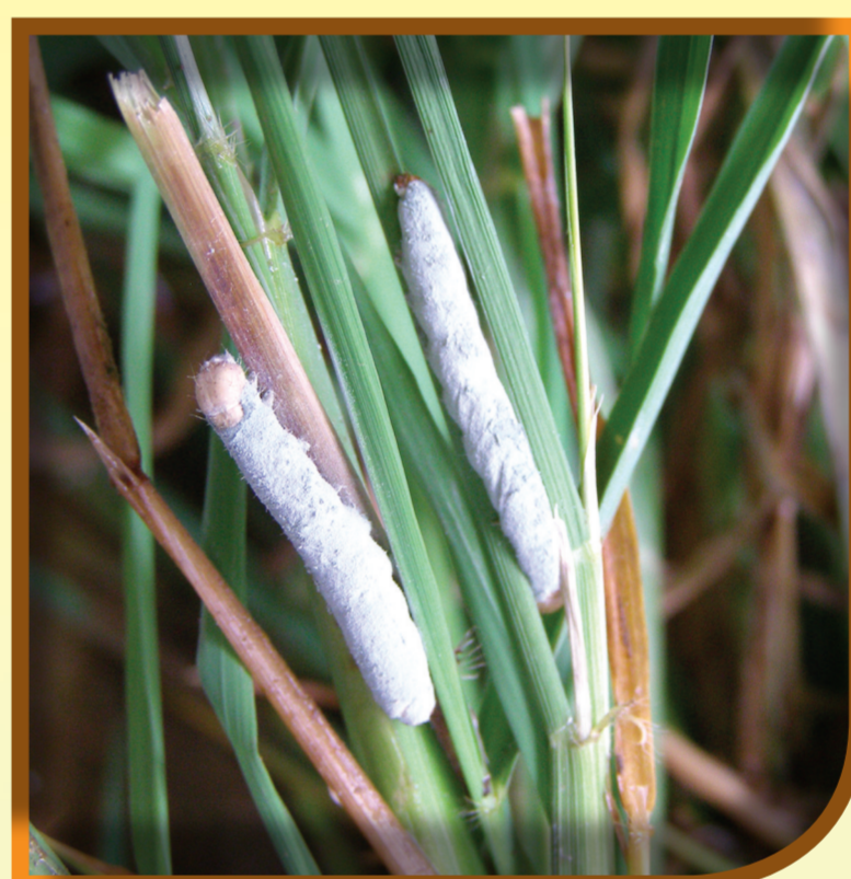
หนอนกระทู้กล้าถูกเชื้อราขาวบิวเวอเรียทำลาย