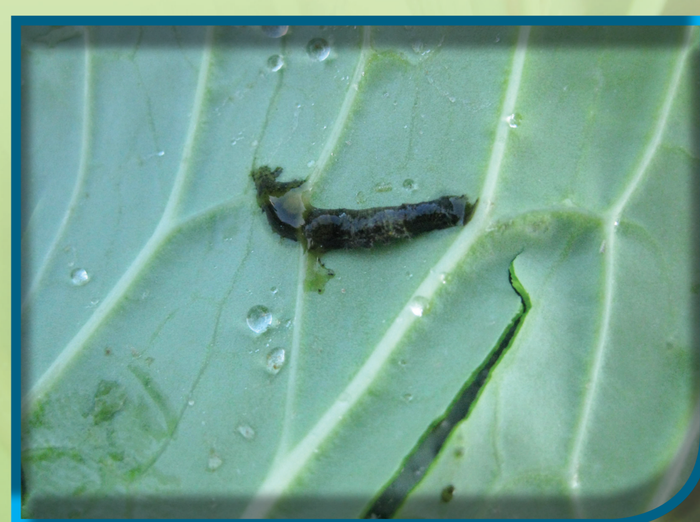
หนอนตายด้วยเชื้อบีที