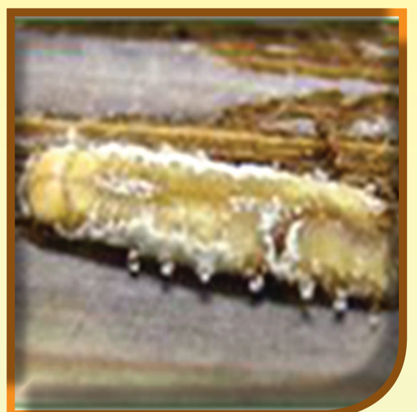
หนอนแมลงตำหนามมะพร้าวถูกเชื้อราขาวบิวเวอเรียทำลาย