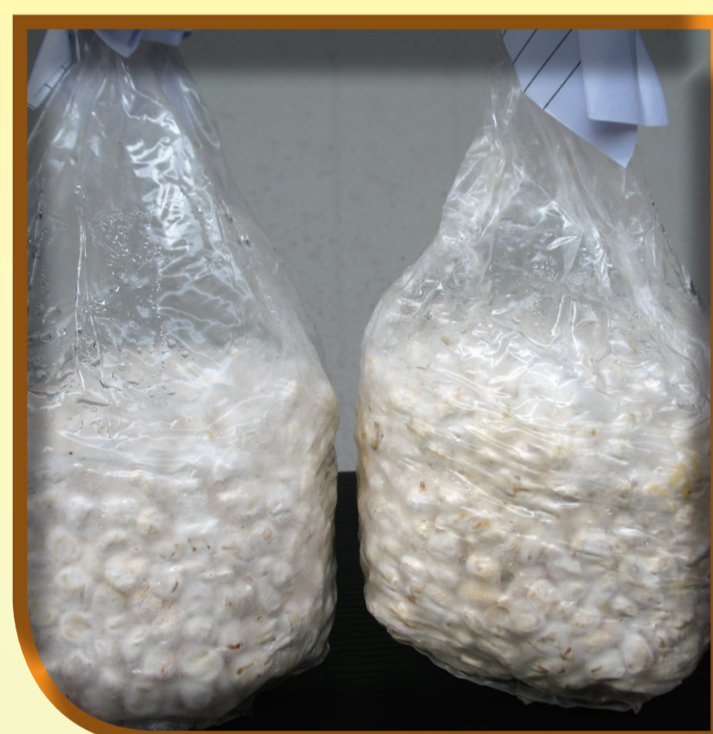
เชื้อราขาวบิวเวอเรีย

เป็นเชื้อราที่เข้าทำลายแมลงศัตรูพืช ได้หลายชนิด เช่น เพลี้ยไฟ ไรแดง เพลี้ยอ่อน เพลี้ยกระโดด แมลงหวี่ขาว หนอนศัตรูพืช เช่น หนอนกระทู้หอม หนอนเจาะสมอฝ้าย หนอนกระทู้ผัก โดยเชื้อราบิวเวอเรียสามารถทำลายทั้งตัวอ่อนและตัวเต็มวัยของแมลง