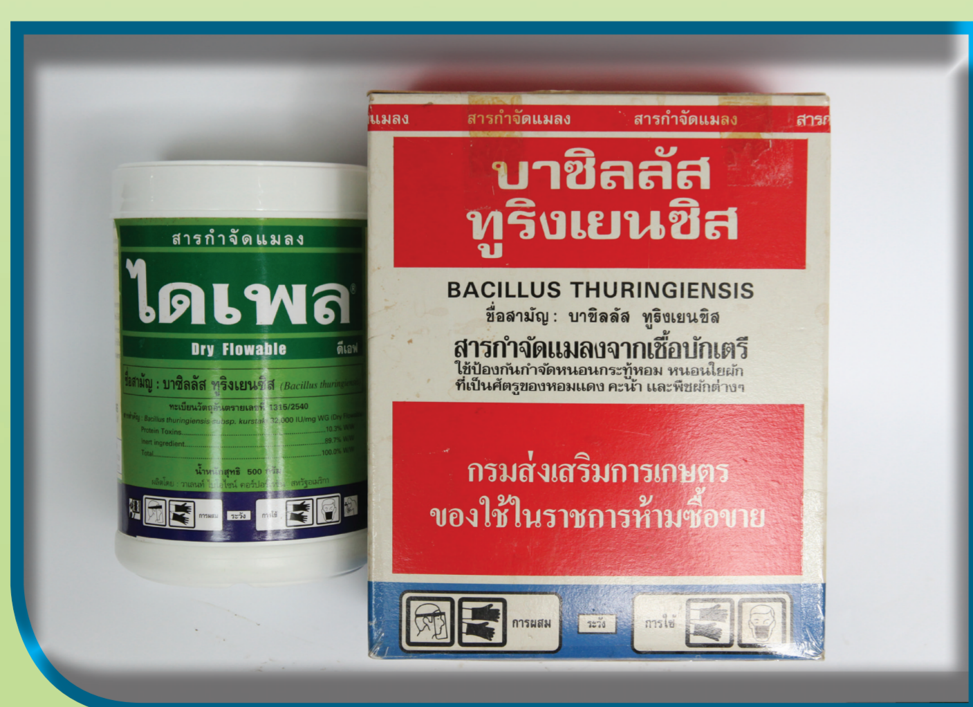
ขวดเชื้อบีที

เป็นเชื้อแบคทีเรียที่นำมาใช้กำจัดแมลงศัตรูพืชและมีความจำเพาะเจาะจงทำลายแมลงศัตรูพืช โดยใช้ควบคุมหนอนผีเสื้อกลางคืนที่เป็นศัตรูพืช เช่น หนอนกระทู้ผัก หนอนห่อใบข้าว หนอนเจาะสมอฝ้าย